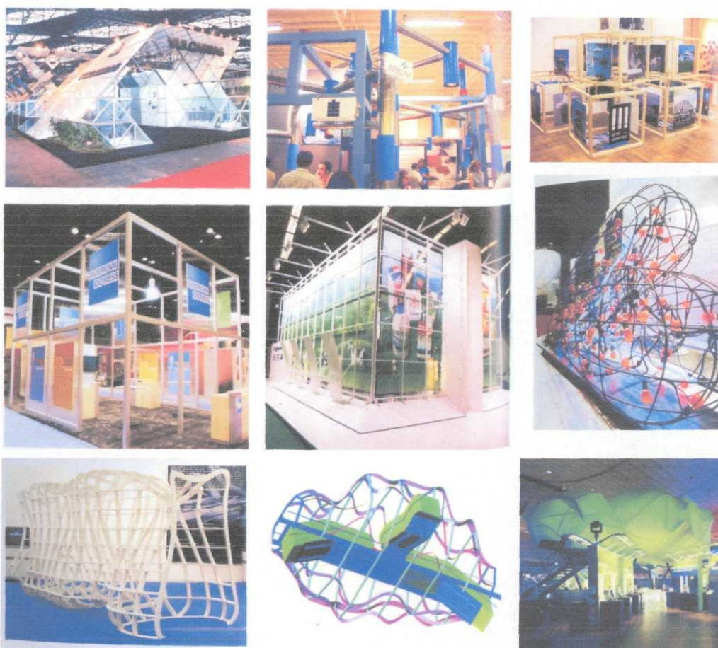
Примеры регулярных и нерегулярных растровых структур